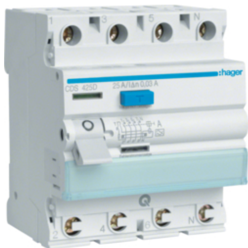
Proudový chránič 4 pól. 25A / 0,03 A, A, 6 kA