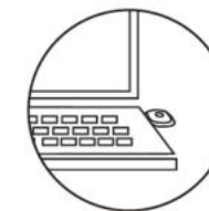
AKO SVETLO DOBIŤ

Svetlo má tri úrovne stmievania. Pre zmenu úrovne stlačte tlačítko.