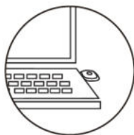
JAK SVĚTLO DOBÍT

Světlo má tři úrovně stmívání. Pro změnu úrovně stiskněte tlačítko.