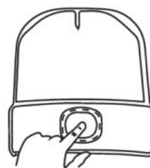
ZAPNÚŤ / VYPNÚŤ