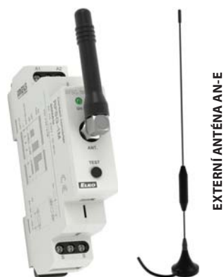
EXTERNÍ ANTÉNA AN-E